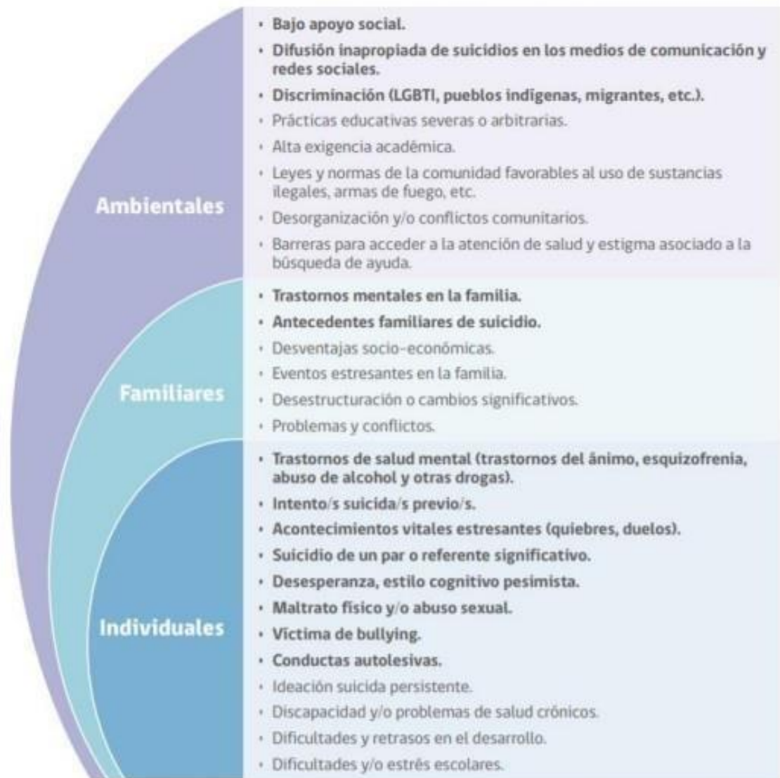
FIGURA 1. FACTORES DE RIESGO CONDUCTA SUICIDA EN LA ETAPA ESCOLAR